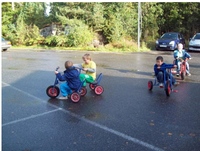
Sykling er gøy...