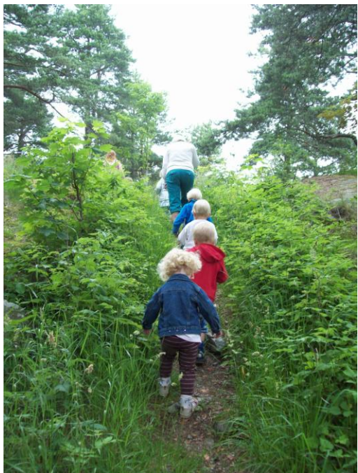
Ut i det grønne....

I tillegg til disse hverdagsaktivitetene har vi ulike prosjekt innen de ulike fagområdene gjennom året.