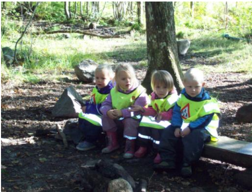
Skautrolla på tur sept-11