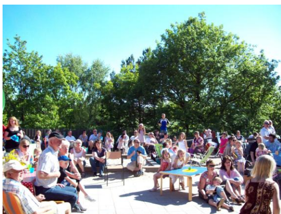
Fra en sommerfest