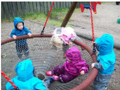
Ute lek med samarbeid

Barna som tar med seg leker hjemmefra, bør takle å låne de bort: Ikke send med noe dere er redde for. Må merkes! Barnehagen har ikke ansvar for det som blir tatt med hjemmefra. Personalet har ikke alltid anledning til å lete etter noe som er borte ved hjemreise.