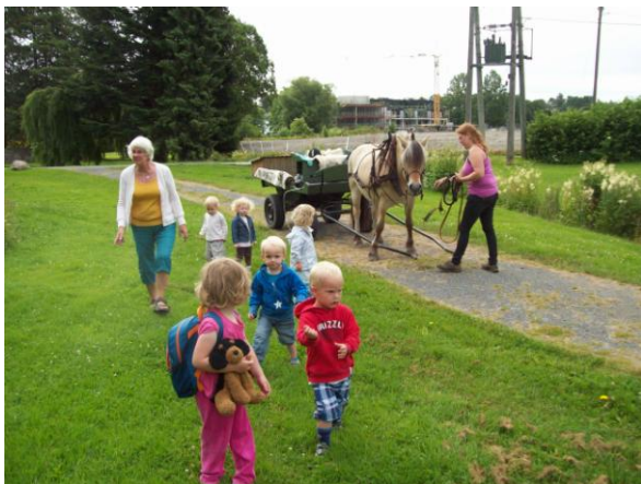
Fra tur med hest til Berge gård

Felles Sangling 1g/mnd. m.m. (sangling er sangsamling)