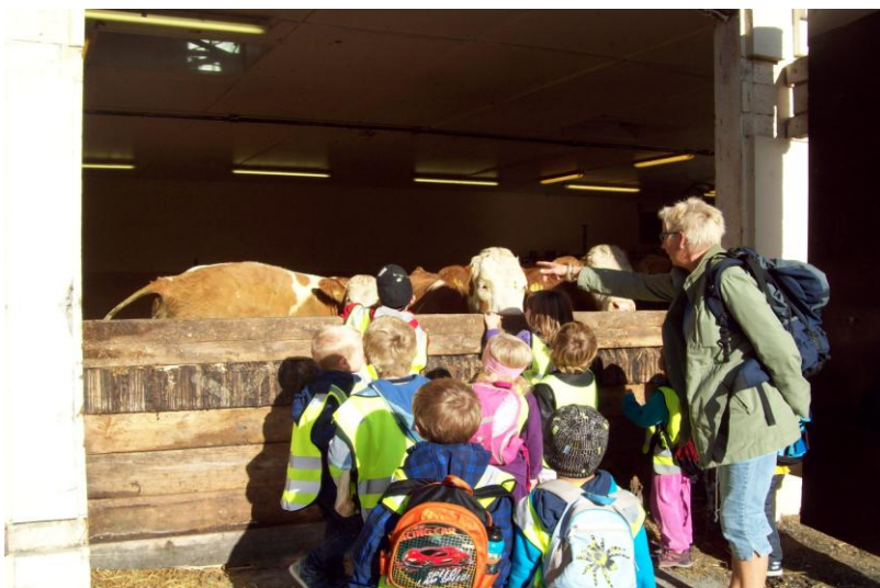
På gårdsbesøk sept-11

Årsplanen skal fungere som et arbeidsredskap for oss her i barnehagen. Den skal også tjene som et bindeledd mellom foreldre og barnehagen. Andre instanser og interesserte kan også gå til årsplanen for å finne info om barnehagen og hva vi står for.