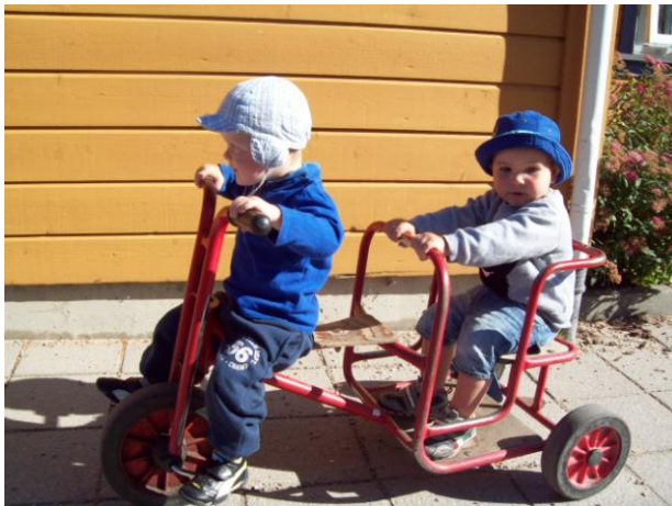
To gode venner på sykkelstur

Vi har en fast ukeplan, men er åpne for å være impulsive og ”gripe dagen” sammen med de menneskene som er her der og da. Barna er vår viktigste ressurs og vi satser på gjensidig respekt.