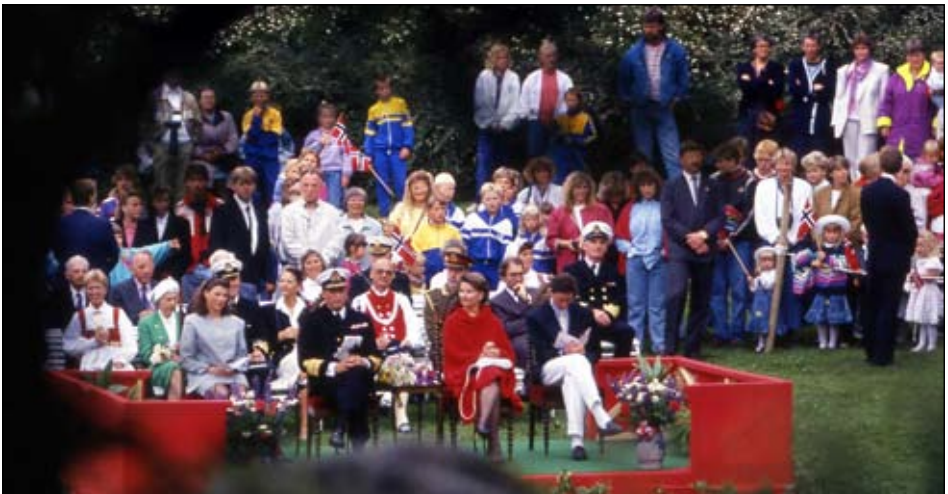
Fra kongefamiliens besøk i Grimstad 28. juni 1991.

Under Ibseniana året etter ble ”Gildet på Solhaug” fremført, og 28. juni 1991, da kong Harald og hans familie besøkte Grimstad under signingsferden, ble de geleidet til et blomsterpyntet amfi på Kirkeheia og fikk servert både prolog, sang og musikk. Og den spontane reaksjonen fra det kongelige følget: Det var flott!