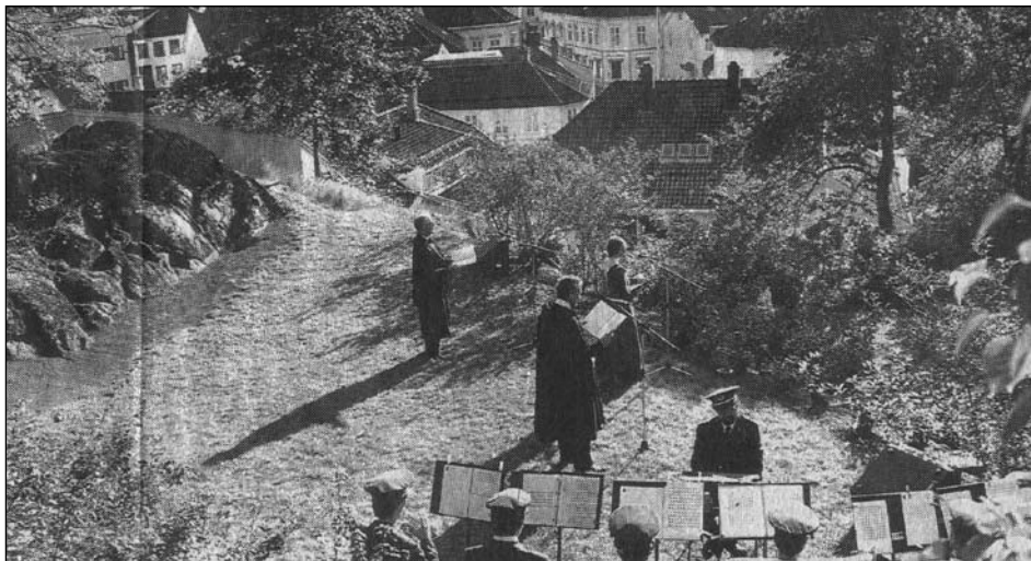
Første gang amfiet ble brukt som scenerom var under Ibseniana i 1989.