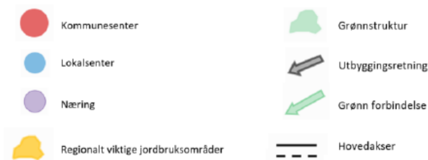
Figur 1: Forslag til kartillustrasjon over Grimstad som en del av arealstrategiene.