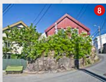
Oline Bruns bakke 2017