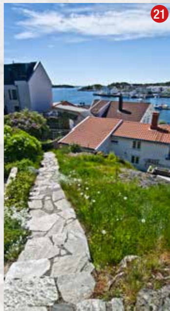
Ned mot Bioddgaten