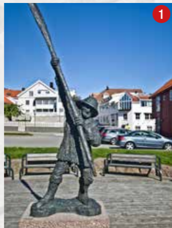
Starten på Terje Vigens brygge