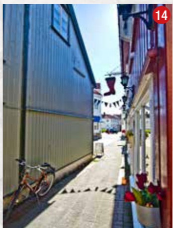
Juskestredet mot Torvet