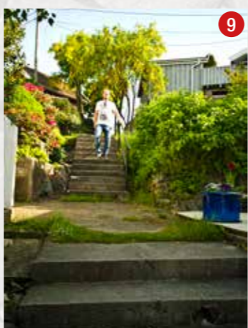
Kaptein Mikalsens vei