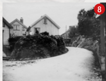
Oline Bruns bakke 1917