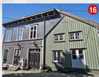
To hus tett i tett