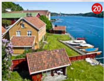
Vikkilen fra Batteriet