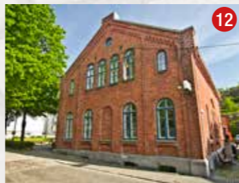
Biblioteket på Knut Hamsuns plass