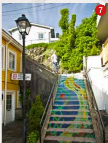
Stinta mellom Lillerore og Storgaten