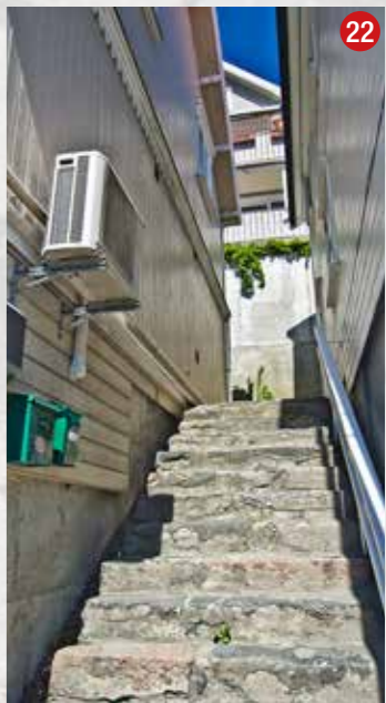
Opp mot Bings Torv og Arendalsveien