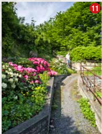
Ned mot Storgaten