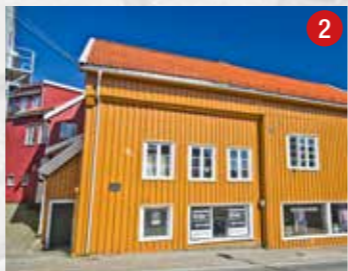
Lauras hus fra 1606