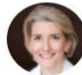
Amy Edmondson Harvard Business School Professor

Psychological safety is a belief that one will not be punished or humiliated for speaking up with ideas, questions, concerns or mistakes.”