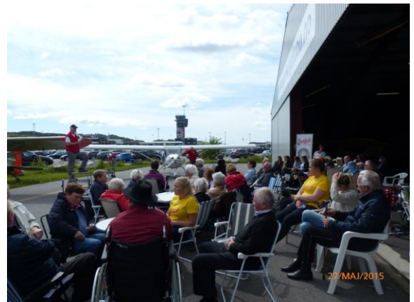
Aktivitetsdag på Kjevik

Vi har gjennom hele året hatt treningsgruppe for personer med demens en ettermiddag i uka. Da er det tur og sosialt samvær i 1,5 time. Noen deltagere kommer selv til gruppa, mens andre blir hentet av frivillige hjemme. Det er totalt mellom 10 og 15 frivillige i den gruppa, i snitt ca 6-7 frivillige og 7-8 deltagere hver gang.