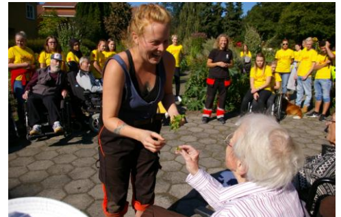
Seniortur til Dømmesmoen