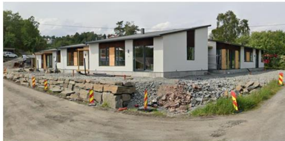
Vollekjær borettslag under bygging